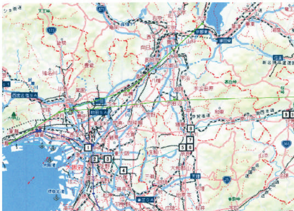
2011年6月5日 第3回調査 (水色)