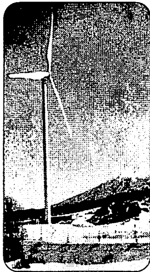
青森県 市民風車 わんず

財界と大手マスコミは「電力不足」の大合唱で再稼働を求めてきました。しかし国民のたたかいと世論で「即時原発ゼロ」が現実の課題となつていきます。「安全な原発」などありえませんが、福島原発事故を体験した日本こそ「原発のない世界」へのイニシアチブを發揮すべきです。